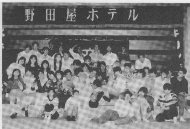
夏季合宿、野尻湖・野田屋ホテルにて