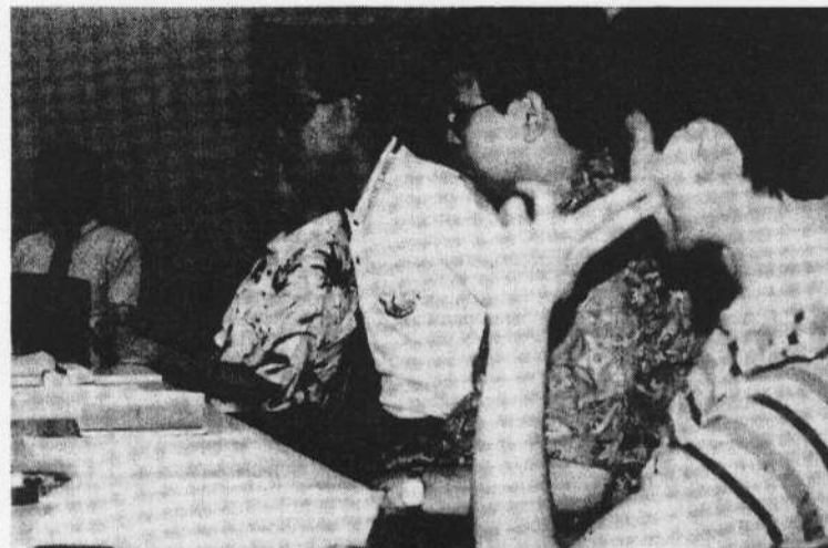
第3回実行委員会打ち合わせ会議にて

ました。合奏・アンサンブルの出演者を募るには具体的にアンサンブルの名称・内容・リーダー・曲目等を明記する事が望ましいという