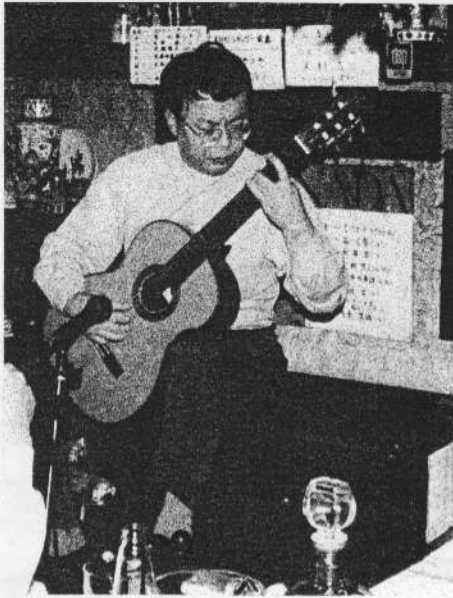
グラナダに出演中の筆者